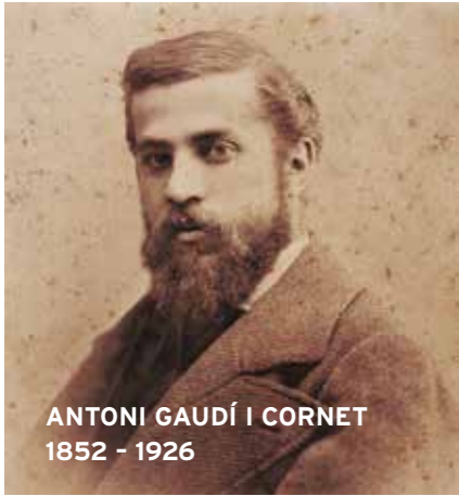
ANTONI GAUDÍ I CORNET 1852 - 1926

Antoni Gaudí va ser el geni del modernisme català i és l'arquitecte més important que ha tingut Catalunya al llarg de la història.